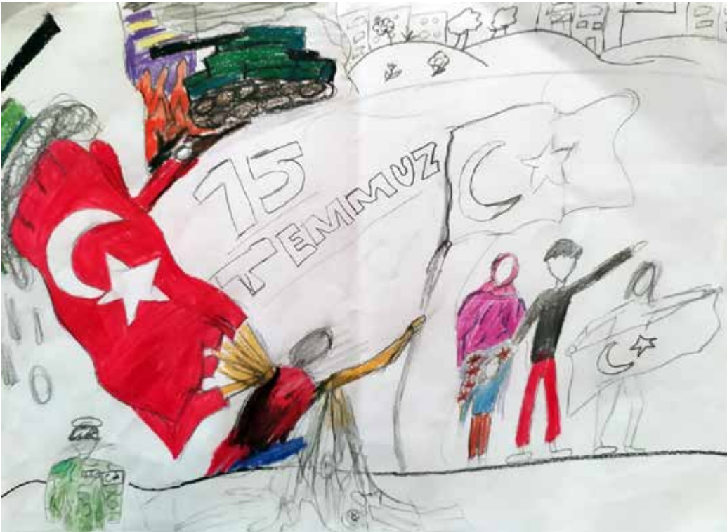
ORHAN ARDA GÜMÜŞLER 6/C