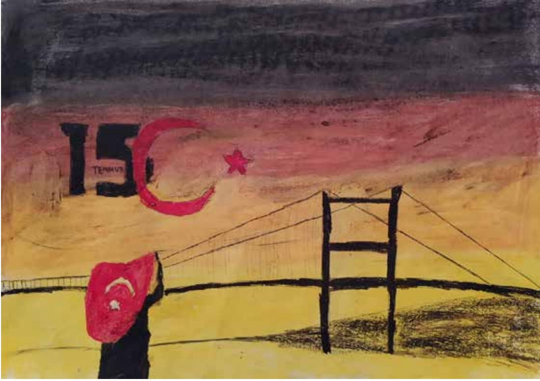
RAVZA DEFNE YILMAZ