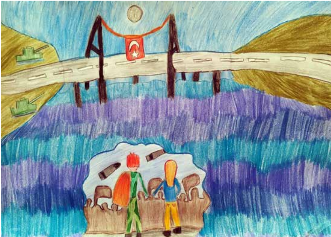
BEYZA BEŞİKÇİ 5-E