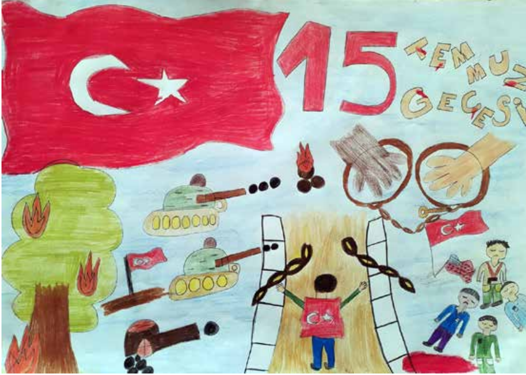
AMİNE ZÜMRA HABİBOĞLU 5-A