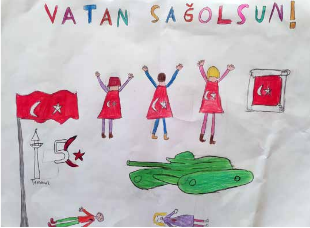
BELİNAY TAŞÇI 5/A